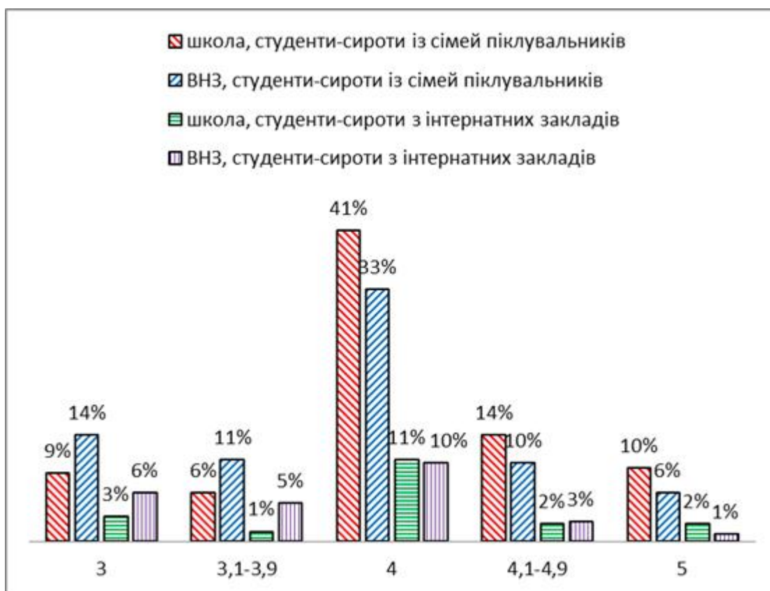
Рис. 2. Порівняльна діаграма успішності сиріт у ВНЗ та загальноосвітніх навчальних закладах (у відповідний період життя)

Проблемність участі студентів-сиріт у навчальному процесі розглянемо більш детально, адже цей напрям в розрізі діяльності ВНЗ є одним з пріоритетних. Як виявилось, п'ята частина сиріт закриває сесії на оцінку 3,0. Добрі та відмінні показники навчання мають 43,0% опитаних; решта (37%) мають середній бал навчання 3,00-4,00. З відповідей сиріт встановлено, що до вступу до ВНЗ їх успішність була кращою, причому відсоток школярів-відмінників зі вступом до ВНЗ падає вдвічі. Відповідність середніх балів подано на рис. 2. Розглядаючи проблеми академічної неуспішності, зазначимо, що 38% студентів-сиріт мають академічні заборгованості, причому їх кількість варіює від 1 до 11, що відповідає кількості навчальних предметів орієнтовно за 2 навчальні семестри.