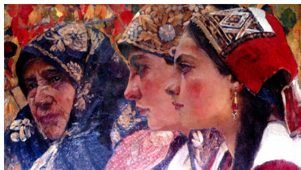
Рис. 3. Федір Кричевський. Три віки. 1913

Вона знайшла втілення в особливій формі автопортрету у трьохфігурній композиції триптиху «Сімейні реліквії» та була розкрита через зображення жінок трьох поколінь однієї родини (Рис. 4). Вони уособлюють ідею продовження життя, збереження цінностей, котрі передаються від попереднього покоління до наступного.