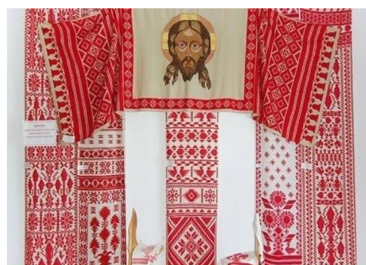
Рис. 5. Крелевецькі ткани рушники. Із фондів музею Крелевецького ткацтва. ХХ ст.

несений лад символічного простору. Таке художнє рішення розширює площину полотна та встановлює художньо-стилістичний та образний зв'язок трьох частин єдиної композиції. За своєю формою та видовженими пропорціями бокові частини нагадують колони (обов'язковий елемент парадного портрету) та утворюють своєрідну модель дому-храму. Трансформація іконографії бокових частин ґрунтується на християнському звичаї в українській культурі – прикрашання ікон «покутними» рушниками, які симетрично обрамляють образ (Рис. 5). Така інтерпретація коріниться в особистих спогадах та родинних традиціях, де зберігалася основна функція рушників – обрядова.