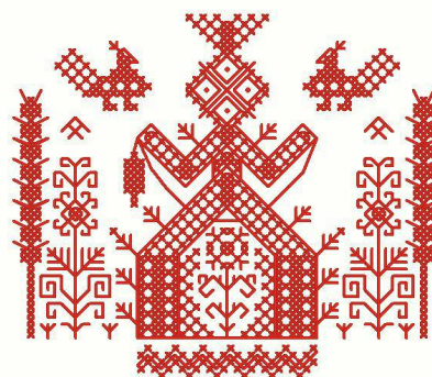
Рис. 1. Орнамент із зображенням Макоші. Схеми для вишивки. XXI ст.

Виклад основного матеріалу. Зміст творів мистецтва, присвячених жіночим образам, традиційно розкривається через архетип Жінки-матері. Жіночий образ сприймається як джерело продовження роду та безперервного циклу відродження, в якому бінарна опозиція «життя-смерть» є природною. Мати – передова фігура там, де відбувається магічне перетворення й воскресіння (Юнг, 2017). Її образ як утілення жіночої енергії Всесвіту, характерний для мистецтва різних світових культур і часів. Культ поклоніння Жінці-Матері закарбувався у дрібній пластиці палеолітичних «Венер», у зображеннях образів Ізиди, Деметри та Церери. Як уважають прихильники міфологічного мислення, надалі він проявився в образі Цариці Небесної (в християнській традиції – Богородиці, в католицькій – Мадонни) (Голан, 1993). Трансформуючись у часі, образ зберіг спільні риси іконографії: фронтальне зображення на повний зріст, підняті вгору руки – жест адорації (рис. 1).