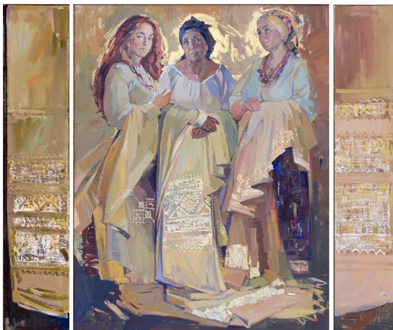
Рис. 4. Марина Пономаренко. Триптих «Сімейні реліквії». 287x200. Полотно, акрил. 2008

Три монументальні жіночі постаті зображені набагато більше натуральної величини та ніби злиті в єдиний моноліт. Таке художнє рішення притаманне творам живопису модерну. Наприклад, у багатьох полотнах Ф. А. Малявіна жіночі образи – метафори Землі, зображені як єдина маса. У більшості таких творів художника