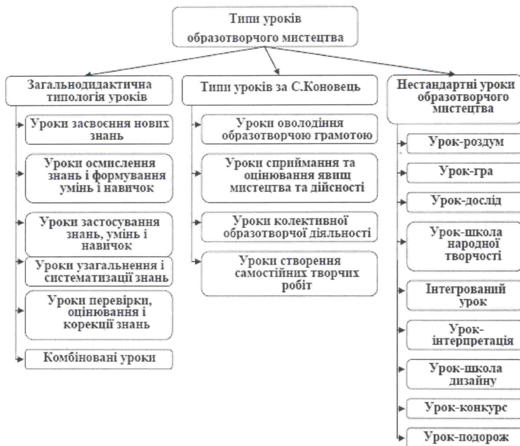
Рис. Типи уроків образотворчого мистецтва