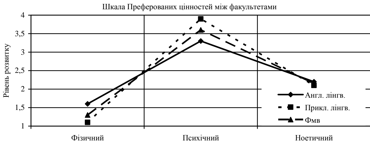
Рис. 1. Порівняльний аналіз шкали обраних цінностей між факультетами

Щодо ноетичного виміру особистості, то результати всіх груп схожі, студенти усіх факультетів виявили нижчий за середній рівень розвитку ноетичного виміру особистості (2,1). Це може засвідчувати, що труднощі в площині вище від наведених результатів не дають змоги гідно реалізувати ноетичні цінності в ділянці особистісного функціонування та формування, ставлення до волі, гідності, зацікавлення у вищих цінностях, інтенційності та ін.