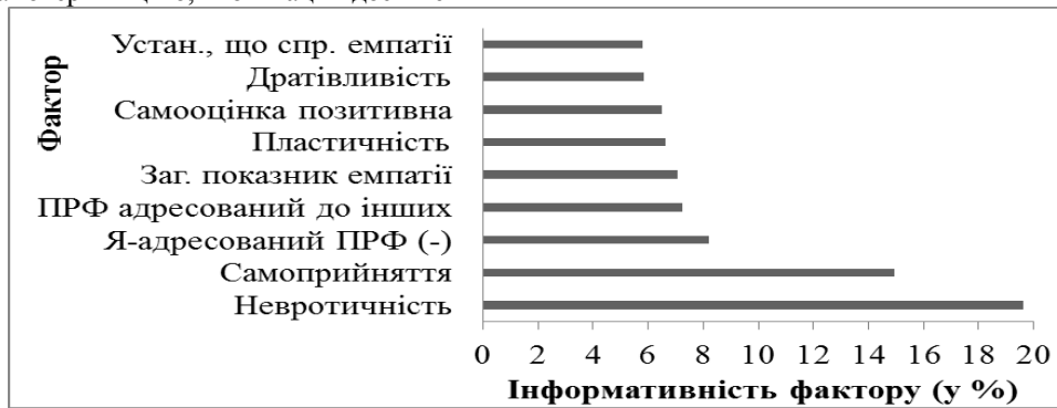
Рис. 2. Номінативно-інформативна факторна структура мотиваційно-поведінкових характеристик студентів з показником перфекціонізму нижче середнього

Номінативно-інформативна факторна структура мотиваційно-поведінкових характеристик студентів з показником перфекціонізму нижче середнього представлена на рис. 2.