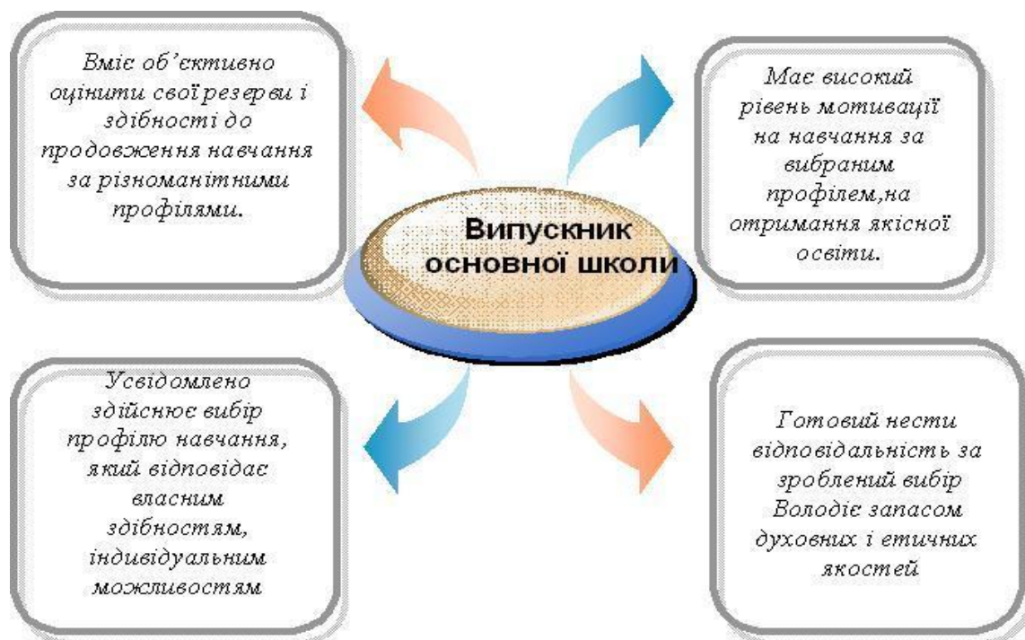
Рис. 1. Модель особистості випускника школи