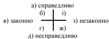
Рис.1. Особливості взаємозв'язку конструктів законності і справедливості та варіанти оцінок в результаті аналізу агресивних ситуацій (б - справедливо і законно; г – законно, але несправедливо; ж – незаконно і несправедливо; і- справедливо, але незаконно)

Система конструктів особистості – це особлива система засобів, створених (сконструйованих) самою людиною, перевірена нею на практиці, яка допомагає людині сприймати та розуміти (конструювати) оточення, прогнозувати та оцінювати події [4]. Конструкти справедливості та законності у масовій свідомості людини пострадянського простору не є тотожними, вони часто протиставляються, тому у нашому дослідженні ми їх зобразимо у вигляді двох перпендикулярно розміщених шкал (Див. Рис.1.), які уможливають вибір варіанту відповіді, який найбільш повно відображає ставлення до ситуації.