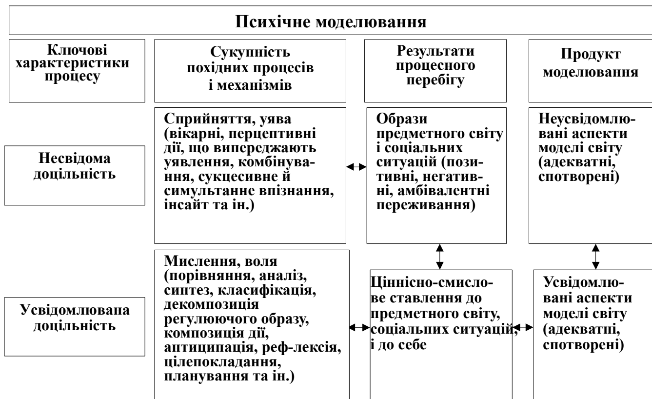
Рис.1. Психічне моделювання: змістова і процесуально-динамічна модель

концептуальної моделі), механізмами якого можна вважати (з урахуванням значень цих термінів у різних напрямках психологічної науки): візуалізацію, комбінування, схематизацію, аналіз, синтез, порівняння, класифікацію, інсайт, вікарні перцептивні дії, декомпозицію регулюючого образу й композицію дії, антиципацію (рис.1).