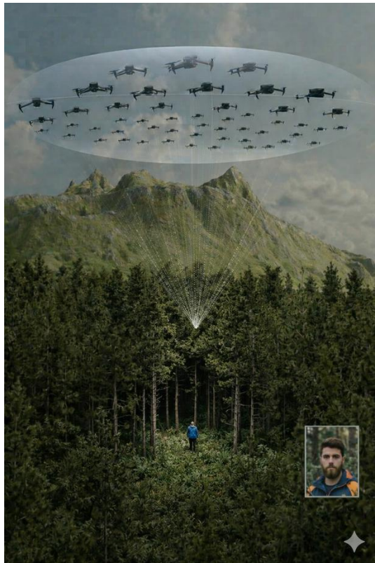
Рисунок 2 – Застосування синергії рою дронів для пошуку людей у густій рослинності