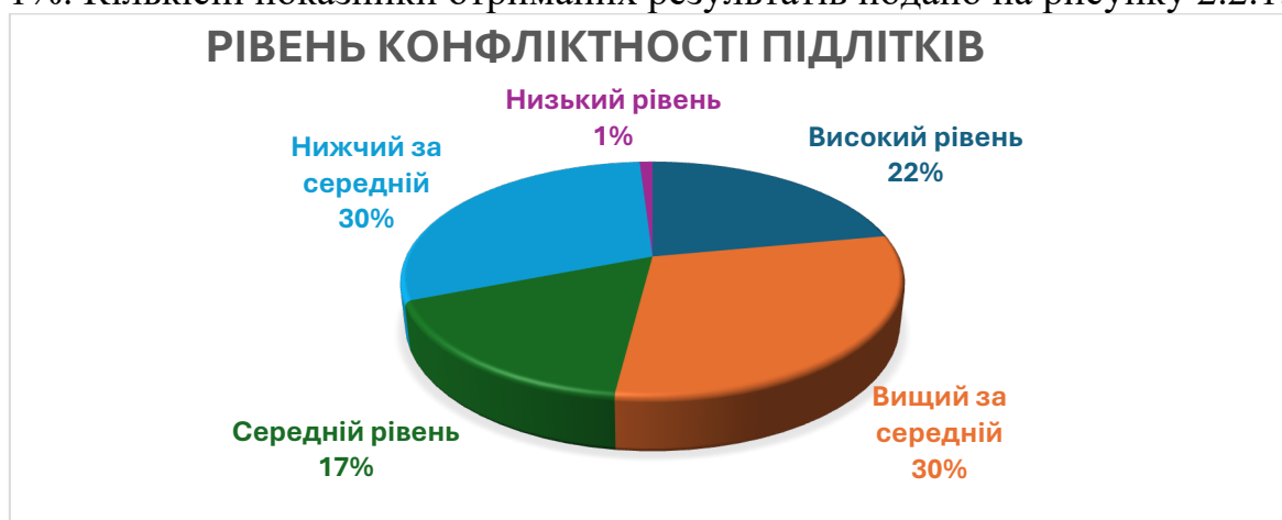
Рис. 2.2.1. Відсотковий розподіл рівнів конфліктності підлітків за результатами методики «Самооцінка конфліктності» С. М. Ємельянова

Так, за результатами методики «Самооцінка конфліктності» С.М.Ємельянова було визначено, що 30% респондентів мають нижчий за середній рівень конфліктності, 17% відносяться до представників середнього рівня, 30% – до рівня вище середнього, та 22% мають високий рівень вираження конфліктності. Низький рівень конфліктності серед сучасних підлітків становить лише 1%. Кількісні показники отриманих результатів подано на рисунку 2.2.1.