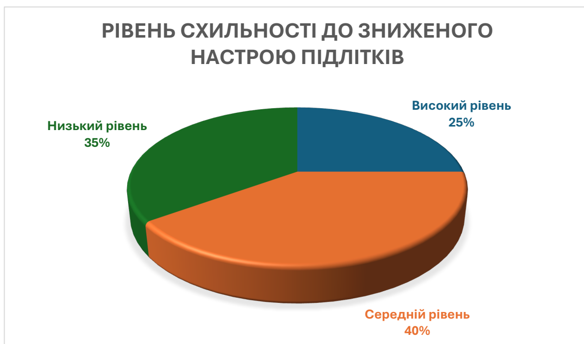
Рис. 2.2.3. Відсотковий розподіл рівнів схильності до зниженого настрою підлітків за результатами «Експрес-діагностики схильності до зниженого настрою» В. В. Бойко

Так, за результатами методики «Експрес-діагностики схильності до зниженого настрою» В. В. Бойко було визначено, що 25% респондентів мають високий рівень схильності до зниженого настрою, у 40% дана особливість проявляється на середньому рівні та у 35% було діагностовано низький рівень схильності до зниженого настрою. Кількісні показники отриманих результатів подано на рисунку 2.2.3.