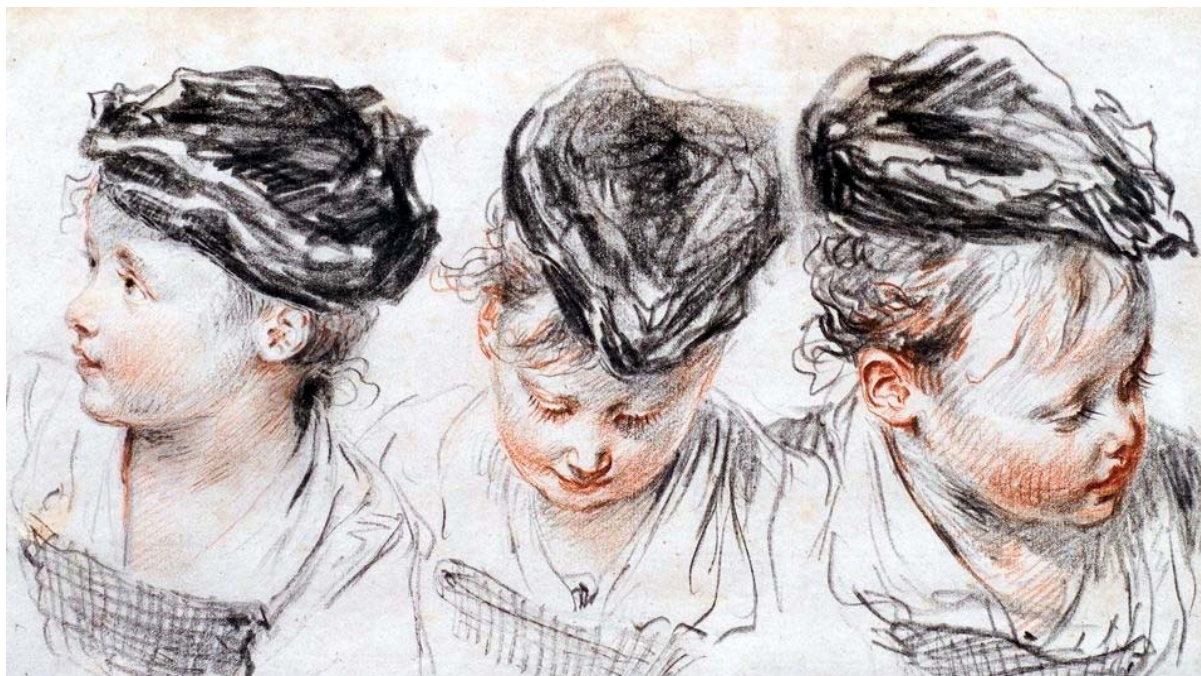
5. Антуан Ватто. Замальовки молоді дівчини у капелюшку. 1716. Папір, італійський олівець, сангіна