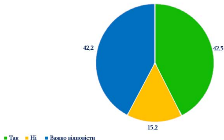
Рис. 1. Чи плануєте Ви після закінчення навчання залишитися та працювати у Вашому регіоні?, %

Запитавши студентів: «Чи плануєте Ви після закінчення навчання залишитися та працювати у Вашому регіоні?» лише 42,5% дали ствердну відповідь «так». Серед опитаних 15,2% студентів які точно не хочуть залишатися та працювати у своєму регіоні. Досить значний відсоток 42,2% хто не зміг визначитися з відповіддю, адже за вікном відбуваються воєнні дії які є чинником невизначеності багатьох молодих людей (див. рис. 1).