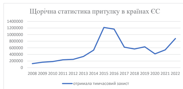
Рис. 2. Щорічна статистика притулку в країнах ЄС [7]

з потужнішою міграційною хвилею ніж у 2015 р. (рис. 2, 3).