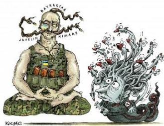
Олексій Кустовський. Дуель.