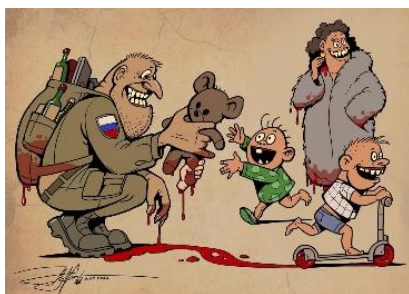
Юрій Журавель Криваві подарунки.