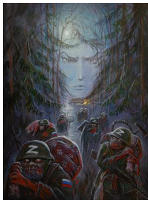
Олег Шупляк. Український ліс.