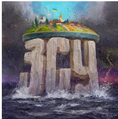
Олег Шупляк. ЗСУ (полотно, олія, 70x70).