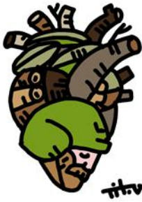
Нікіта Тітов. Серце ЗСУ