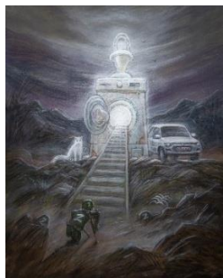
Олег Шупляк. Вальгала рашиста.