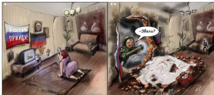
Георгій Ключник. Звали?