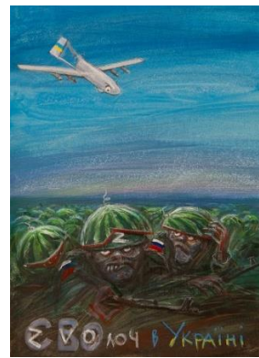
Олег Шупляк. Сволота в Україні.

Висновки. Повне або хоча б часткове розуміння змісту політичної карикатури можливе через адекватне сприйняття її візуально-просторових образів та вербальної складової. Візуальний та вербальний коди, у свою чергу, взаємодіють із соціальним, культурним та ідеологічним кодом нації, без знання якого неможливо зрозуміти глибинний зміст повідомлення. Елементи, що входять до ядра когнітивного простору