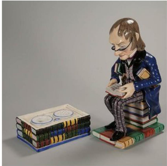
3. Вироби Волокитинського заводу: «Ваза з квітами», «Бібліофіл».