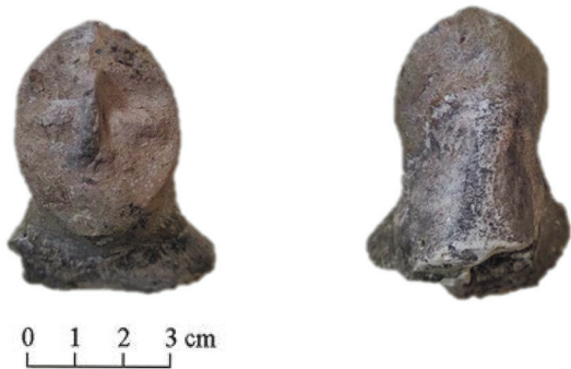
Додаток 1. Фрагмент 1 статуетки з Ніконію.

Багаторічні дослідження дозволяють реконструювати вигляд цього стародавнього міста, його вулиці, храми, житлові приміщення. Незважаючи на те, що з часом Ніконій занепав і був покинутий, археологічні