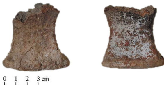
Додаток 2. Фрагмент 2 ніжка від курильниці або фрагмент теракоти.

знахідки і руїни можуть розповісти про його багату історію та культурну спадщину [1].