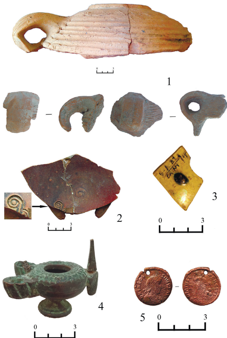
Рис. 1. Деякі знахідки пізньоантичного часу з Тіри. 1 – фрагменти амфор; 2 – фрагмент червонолакової миски; 3 – фрагмент склянки з краплею синього скла; 4 – бронзовий світильник; 5 – бронзова монета