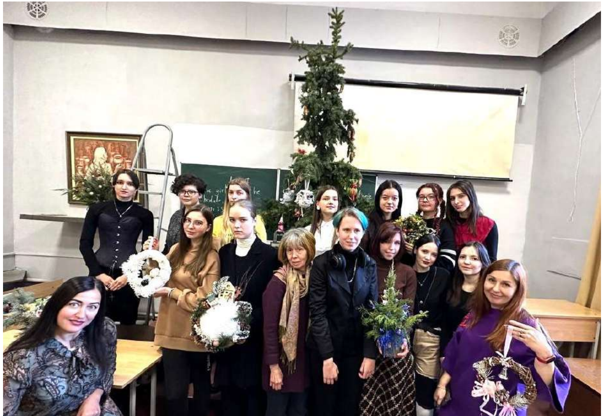
VI Всеукраїнська науково-практична конференція студентів та молодих вчених (4 – 5 грудня 2023 р.)