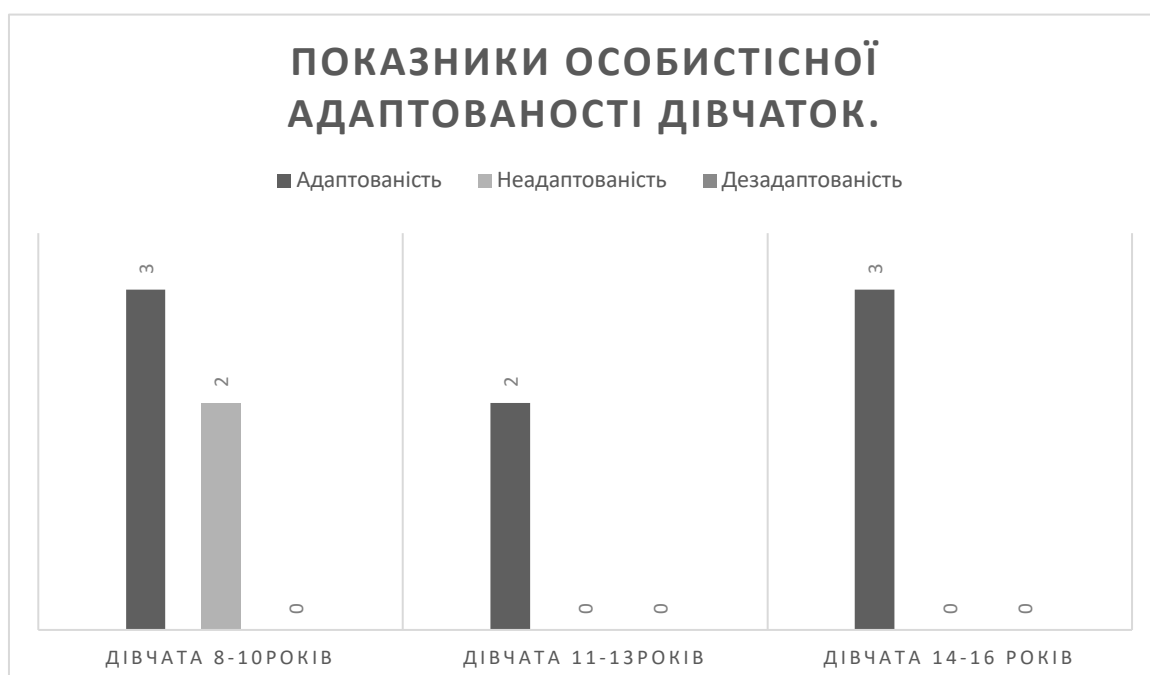
Діаграма 3. Показники особистісної адаптованості дівчаток.

З діаграм бачимо наступну картину: 79,17 % дітей добре адаптовані до життя і навчання в навчальних закладах за кордоном, мають певні гармонійні відносини з навколишнім середовищем. Найбільшу частку добре адаптованих дітей складають діти віком 8-10 років та дівчата 14-16 років.