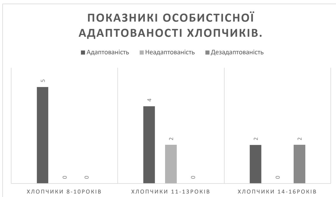
Діаграма 2. Показники особистісної адаптованості хлопчиків.