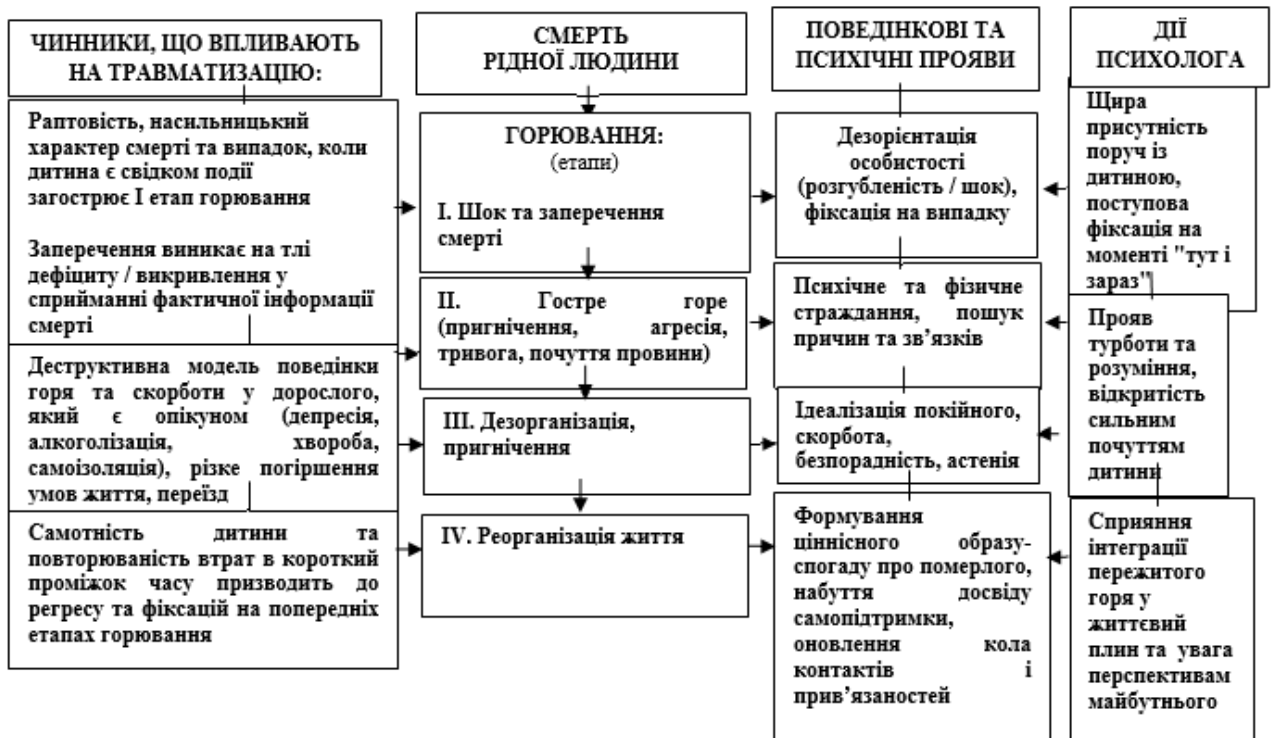
Рис. 2. Модель психологічного супроводу дітей, які переживають горе втрати

динаміку горювання. Заперечення факту втрати близької людини виникає на тлі дефіциту або ж викривлення сприймання фактичної інформації про смерть.