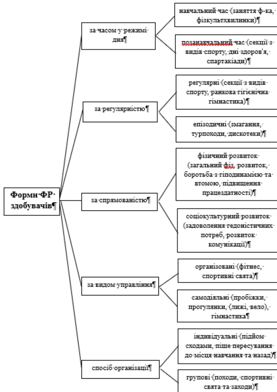
Рис. 1. Класифікація форм фізичної рекреації здобувачів

Існує три основні аспекти специфіки життєдіяльності студентської молоді з використанням форм рекреаційно-оздоровчої спрямованості – вступна, основна та перехідна [1].