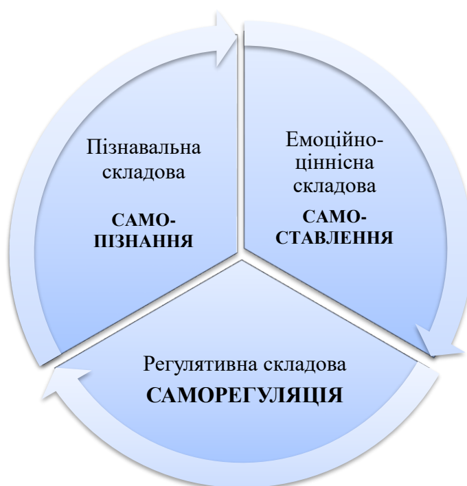
Рис. 2. Структура самосвідомості

Методичні вказівки. Студенти повинні звернути увагу на зміст понять «індивідуальна свідомість» та «самосвідомість», розкрити їх структурні компоненти та особливості прояву. Розглянути самосвідомість як об'єкт психодіагностичного дослідження, проаналізувати психологічний аспект дослідження проблеми самосвідомості (уявлення про себе, рефлексія, реальність). Перш ніж використовувати методи й методики дослідження свідомості й самосвідомості слід вивчити теоретичні основи структурного підходу, тобто, єдності трьох складових – пізнавальної (самопізнання), емоційно-ціннісної (самоствавлення) і дієво-вольової, регулятивної (саморегуляція) (див. рис.1). Необхідно звернути увагу на найбільш важливі методики діагностування самосвідомості, а саме: стандартизовані самозвіти (тести-питальники, списки дескрипторів, шкальні техніки); нестандартизовані самозвіти (вільні самоописи), результати контент-аналізу; на ідеографічний підхід (методики типу репертуарних решіток, проєктивні техніки разом із рефрактивними техніками тощо; на методика «Шкала сумлінності» В. В. Мельнікова, Л. Т. Ямпольського та «Тест-опитувальник самоствавлення особистості» С. Р. Пантілеєва, В. В. Століна.