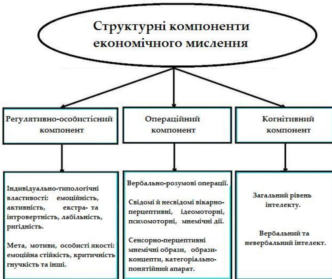
Рис. 1 Структурні компоненти економічного мислення

Беручи до уваги наявні підходи й принципи дослідження економічного мислення в навчально-професійній діяльності студентів, зокрема, діяльничого підходу (О.М. Леонтьєв, С.Л. Рубінштейн та інші), принципу детермінізму (К.О. Абульханова-Славська, А.В. Брушлінський та інші), принципу системності (Б.Ф. Ломов, К. Марков та інші), особливостей розвитку (Б.Г. Ананьєв, Л.І. Анциферова, С.Д. Максименко та інші), принципу функціональності (М.В. Самоукін, В.Д. Шадриков та інші), нами була виділена система взаємопов'язаних структурних компонентів економічного мислення: операційний, когнітивний, регулятивно-особистісний (див. Рис. 1).