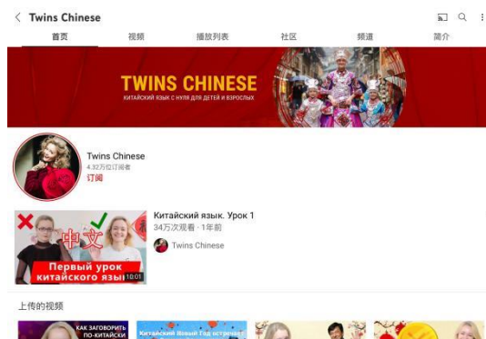
图 3 Twins Chinese 视频号主页截图

Twins Chinese 于 2019 年 4 月 29 日加入 YouTube。以 2021 年 2 月 6 日为基准，订阅人数是 432000 名，到目前为止上传的视频数共有 162 篇，观看量超过 168 万次。Twins Chinese 主要由安娜·库兹娜一位老师用俄语及汉语授课，安娜被 MIA《今日俄罗斯》评为最佳中国内容博主。