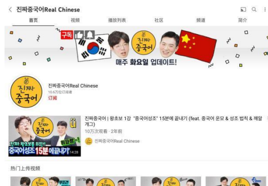
图 2 Real Chinese 视频号主页截图

Real Chinese 于 2017 年 8 月 22 日加入 YouTube。以 2021 年 2 月 6 日为基准，订阅人数是 106000 名，到目前为止上传的视频数共有 731 篇。Real Chinese 是韩国大型外语培训机构 Pagoda 运营的汉语学习频道。教学视频由韩国老师和中国老师一起用韩语授课。