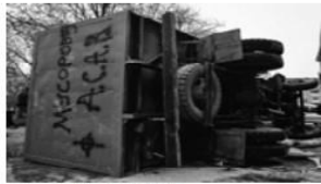
Мал. 9. Лютий 2014 р.