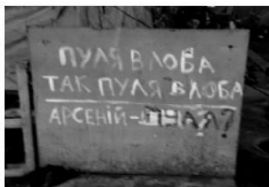
Мал. 4. Майдан Незалежності, березень 2014 р.