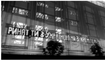
Мал. 5. Вул. Хрещатик, ЦУМ. Київень 2014 р.