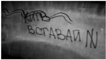
Мал. 6. Європейська площа, підземний перехід. Київень 2014 р.