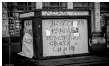
Мал. 3. Вулиця М. Грушевського, березень 2014 р.