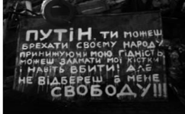
Мал. 11. Вул. Хрещатик, березень 2014 р.