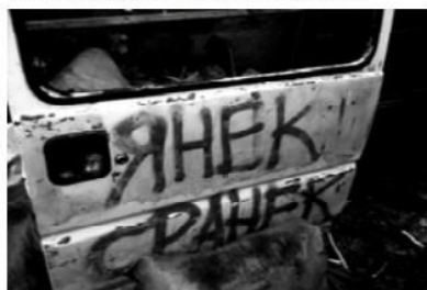
Мал. 2. Вул. Хрещатик, 2014 р.