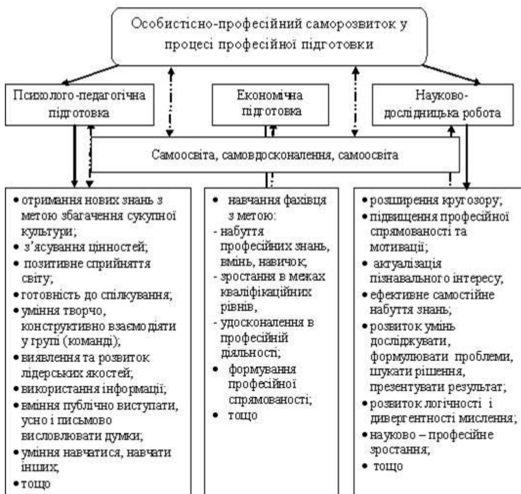
Рис. 1. Особистісно-професійний саморозвиток у процесі навчання

Це пояснюється тим, що, по-перше, науково-дослідницька робота студента створює умови для налагодження контактів зі спеціалістами галузі, отримання поглибленої інформації щодо економічних досліджень ринку, закордонного досвіду розвитку бізнесу, ознайомлення науково-педагогічної спільноти з результатами своєї роботи через публікації та участь у конференціях, тематичних семінарах, інших комунікативних заходах.