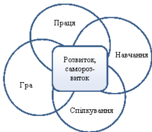
Рис. 3. Місце розвитку та саморозвитку в діяльності людини

майбутніми професіоналами, що діяльність є єдиною можливістю людини реалізувати себе, що саме в об'єднанні основних чотирьох її видів - праці, грі, спілкуванні, навчанні – є місце розвитку та саморозвитку особистості (Рис. 3).