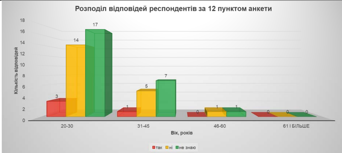
Рис. 6 Розподіл відповідей респондентів за 12 пунктом анкети

З огляду простого порівняння розподілу відповідей із попередніми пунктами анкети доцільно дійти висновку, що в закладах освіти, в яких працюють або навчаються респонденти, система контролю, виявлення, або запобігали випадків порушення норм академічної доброчесності функціонує вкрай незадовільно, адже лише 8 % респондентів відзначили, що обізнані із випадками і відповідно адміністративними санкціями, які були застосовані до порушників академічної доброчесності, а 51 % відсоток водночас стверджують, що «не знає», чи такі випадки були взагалі.