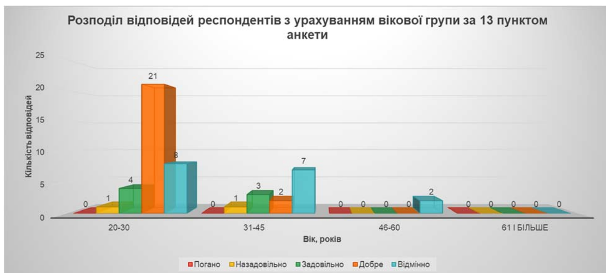
Рис. 7 Розподіл відповідей респондентів з урахуванням вікової належності за 13 пунктом анкети

Висновки. Таким чином, можна дійти таких важливих висновків, які полягають в тому, що в закладах освіти не повною мірою сформоване належне середовище, в якому можна було б ефективно формувати культуру академічної доброчесності в учасників освітньо-наукового процесу, відсутня ефективна система просвітницької діяльності, формування відповідних традицій і норм поведінки, належного інформування щодо особливо важких наслідків для порушника в частині порушення ним вимог академічної доброчесності, які повною мірою узгоджуються із змістом корупційних дій (хабарництво, безпідставного надання переваг або створення перешкод, шахрайство для отримання незаконної вигоди тощо).