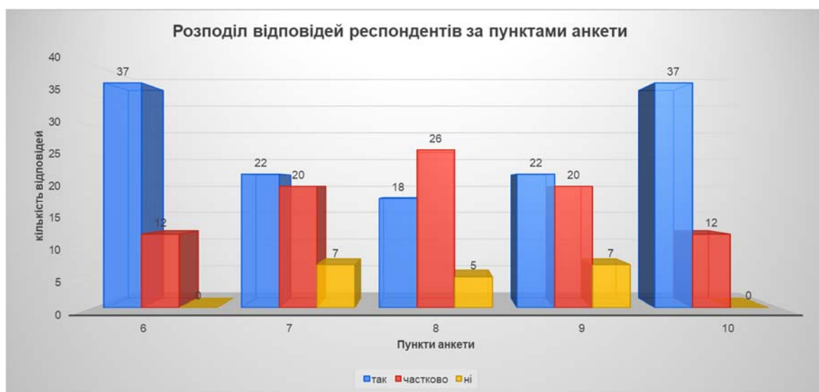
Рис. 4 Розподіл відповідей респондентів за 6-10 пунктами анкети

Коротко зупинимось на результатах: 76 % респондентів вважають, що вони ознайомлені зі змістом критеріїв, правил і процедур оцінювання здобувачів освіти і лише 24 % – обізнані із ними частково. Меншим є цей показник в частині обізнаності зі змістом критеріїв, правил і процедур оцінювання діяльності педагогічних і науково-педагогічних працівників, де 41 % респондентів відповідли, що ознайомлені частково і 14 % не ознайомлені взагалі. Ще меншим є показник обізнаності зі змістом критеріїв, правил і процедур оцінювання управлінської діяльності керівних працівників, де лише 37 % відповіли «так», 53 % оцінили свою обізнаність як «часткову», а 10 % – констатували факт необізнаності із цього питання. Це свідчить, що респонденти більше звертають увагу лише на ті практичні аспекти, які безпосередньо стосуються їхньої професійної діяльності або ті, які необхідно знати під час навчання, але залишаються в більшості поза увагою питання оцінки діяльності своїх керівників, що значно зменшує ймовірність якісного контролю з боку трудового колективу діяльності адміністрації закладу освіти, а під час і унеможлиблює об'єктивну оцінку, яка є надзвичайно важливою в процедурах обрання ректора, деканів, завідувачів кафедрами, інших посад педагогічних та науково-педагогічних працівників.