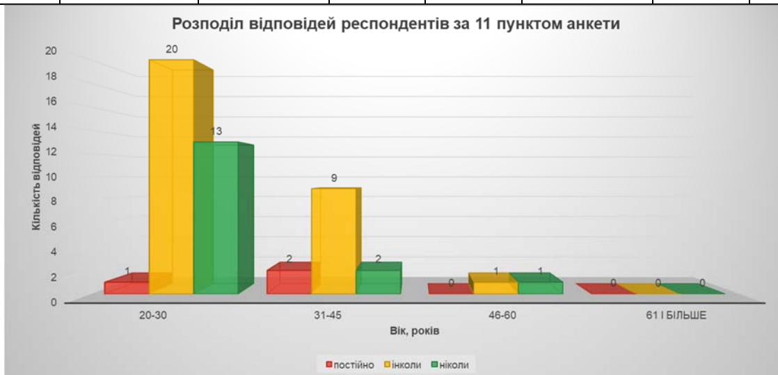
Рис. 5 Розподіл відповідей респондентів за 11 пунктом анкети

Слід відзначити, що більшість респондентів надали правдиву та об'єктивну відповідь, про що свідчать цифри: 6 % відзначили, що вони зустрічаються з такими порушенням постійно, а 66 % констатували, що вони зустрічаються із порушенням вимог академічної доброчесності «інколи», але тут не визначається як часто (один на рік, раз у півріччя), що дозволяє стверджувати про непоодинокі випадки у їхній професійній діяльності порушень вимог академічної доброчесності. Сукупний показник наявності порушень становить 67 % проти 33 % відповідей респондентів, які відзначили, що у своїй практиці вони не зустрічались з порушеннями вимог академічної доброчесності взагалі. Такий попередній розподіл свідчить, що в практиці функціонування закладів освіти порушення вимог академічної доброчесності – це звичайне і повсякденне явище, і що культура академічної доброчесності не сформована на теренах освітньої галузі України, а ті традиції, які були сформовані в попередні часи, втрачені і забуті.