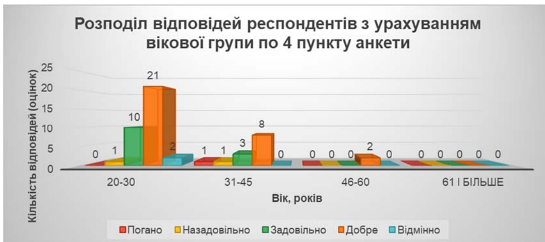
Рис. 2 Розподіл відповідей респондентів з урахуванням вікової групи за 4 пунктом анкети

Попереднє твердження повністю підтверджується результатами опрацювання відповідей на п'ятий пункт анкети, який передбачав оцінку внутрішньої системи забезпечення якості освіти у закладі, в якому респондент навчається або працює (див. табл. 3 та рис. 3).