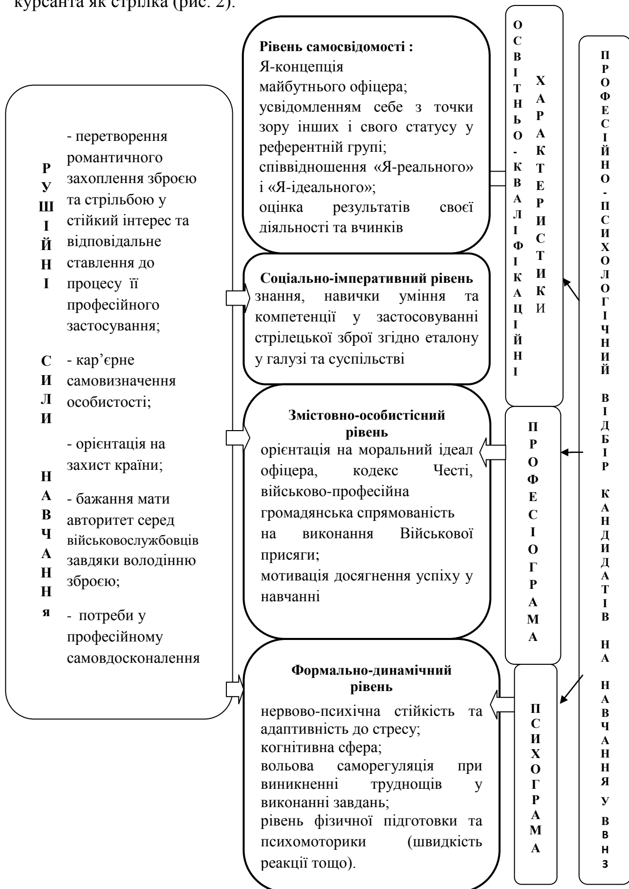
Рис. 2. Структура особистості курсанта як стрілка

Завдяки цим теоретичним надбанням нами уточнена структура особистості курсанта як стрілка (рис. 2).