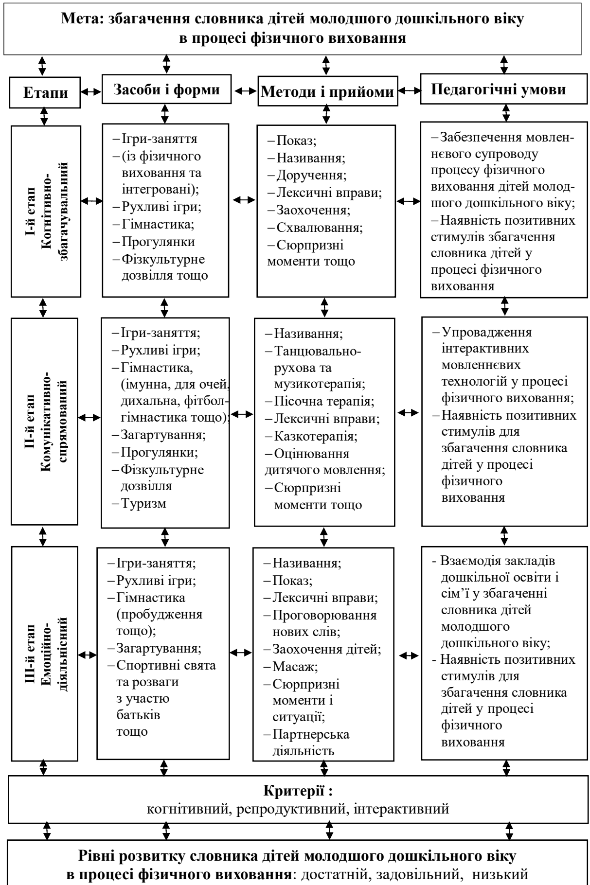
Рис. Модель збагачення словника дітей молодшого дошкільного віку в процесі фізичного виховання