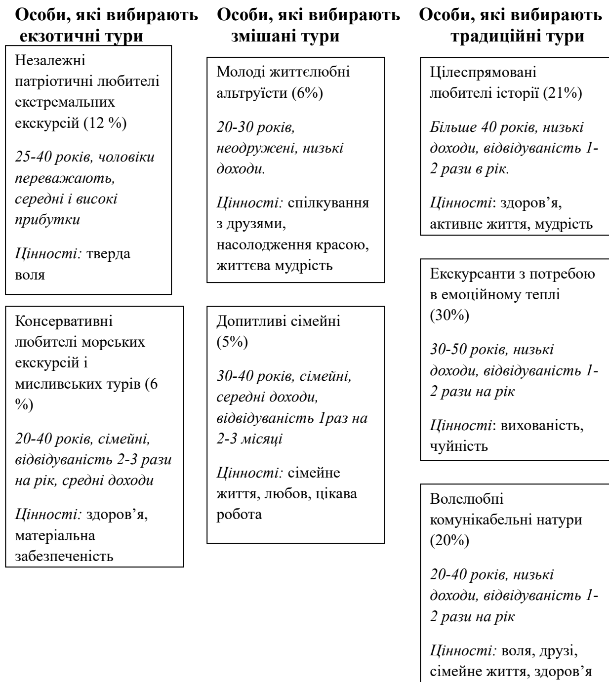
Рис.1. Типологія місцевих екскурсантів на основі кластерного аналізу

традиційних турів; 2) рекреанти, орієнтовані на вибір екзотичних турів; 3) рекреанти без схильності до певних видів відпочинку. Якісний аналіз даних дозволив виокремити специфіку емотивної, мотиваційної та ціннісної сфер у представників виділених типів та на цій основі скласти їх психологічну характеристику (рис.1; рис.2.).