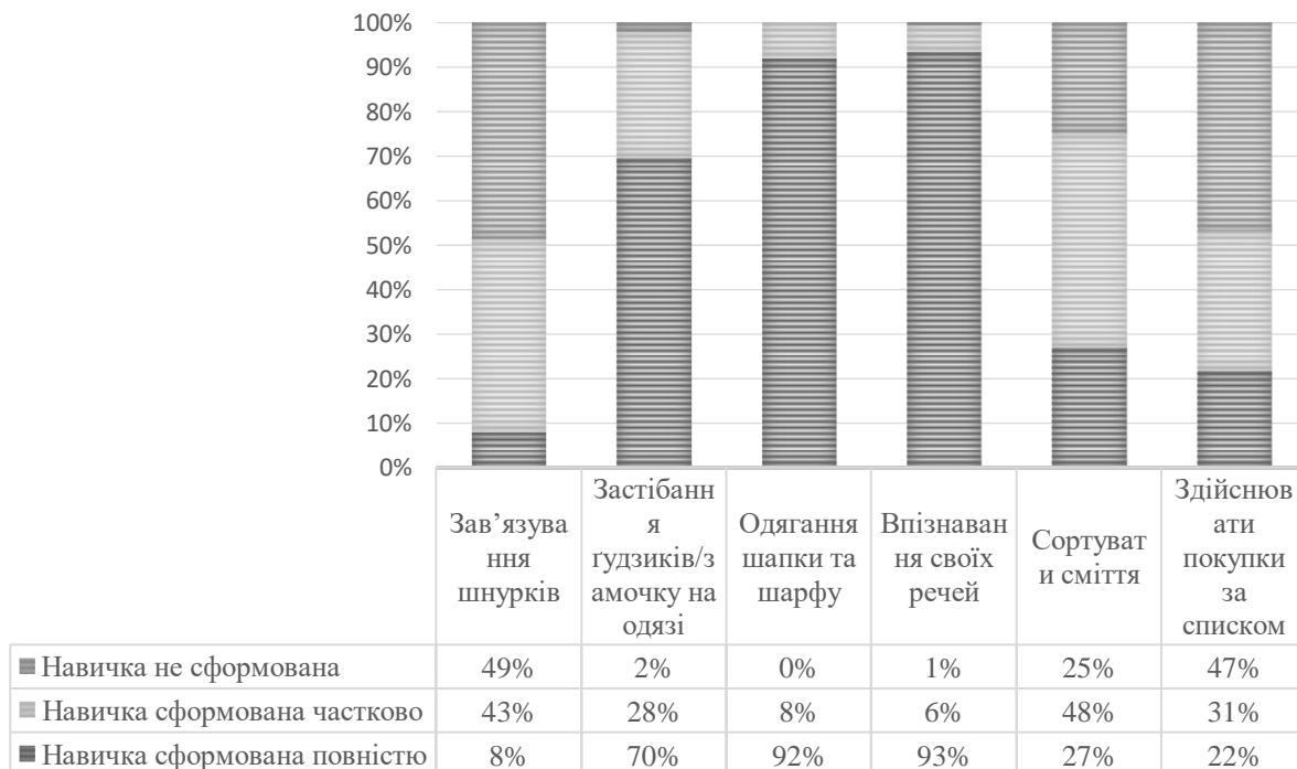
Рис. 2. Оцінка батьками дітей з елітарних сімей рівня сформованості у них побутових навичок (за результатами опитування)

(93 %) та одягати шапку та шарф (92 %), застібати гудзики та замочки на одязі (70 %). Третина батьків відзначили, що їхні діти вміють сортувати сміття (27 %), здійснювати покупки за списком (22 %). Найгірше виходить у дітей з елітарних сімей зав'язувати шнурки – ця навичка сформована повністю, за спостереженням батьків, лише у 8 % дітей.