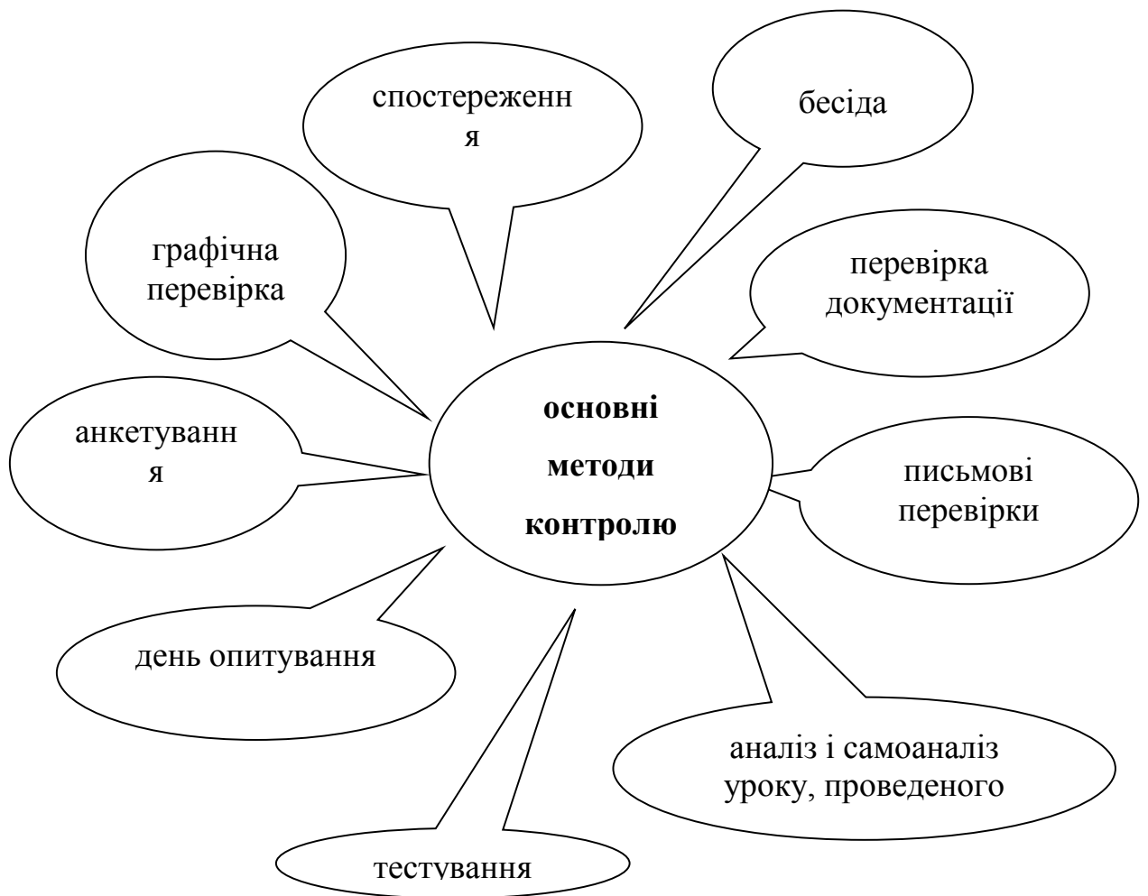
Рис. 2. Основні методи контролю