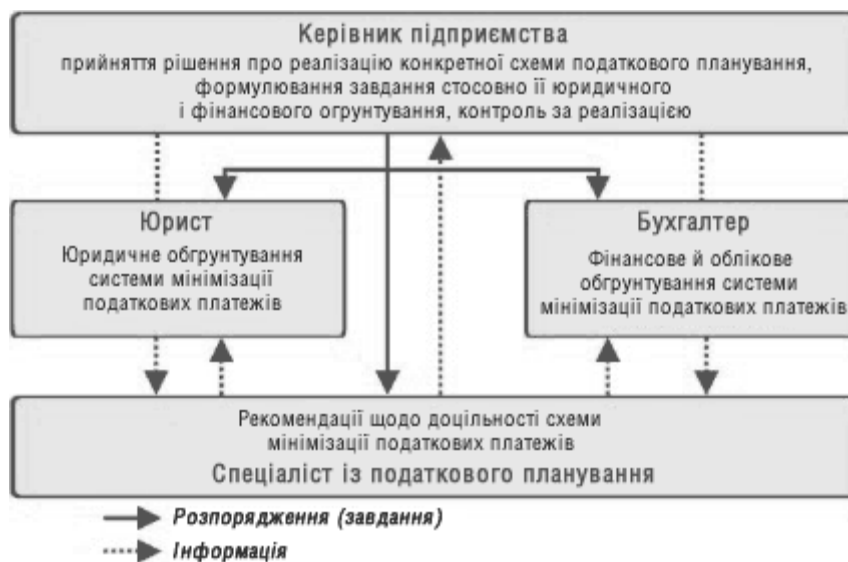
Рис. 1. Схема оптимізації податкових платежів

• фахівець із податкового планування оцінює всю інформацію, що надійшла від керівника, юриста і бухгалтера, і дає висновок стосовно можливості й доцільності реалізації такої схеми (див. рис. 1).