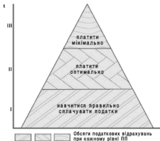
Рис. 2. Схема рівнів податкового планування