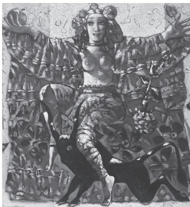
Микола Прокопенко. Буфонада Іспанії. 2004. Полотно, олія. 115 × 115