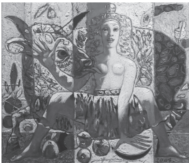
Микола Прокопенко. Нова Європа. 2004. Полотно, олія. 106 × 120