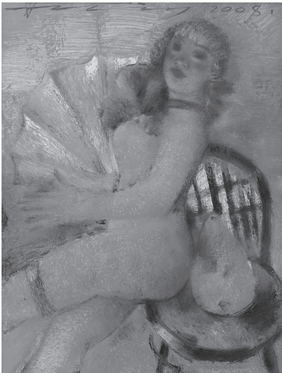
Микола Прокопенко. Віяло Золоте. 2008. Полотно, олія. 115 × 89