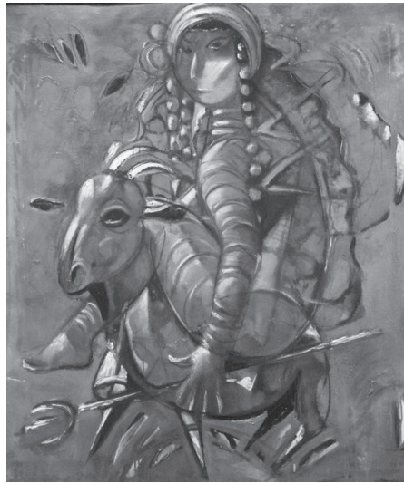
Микола Прокопенко. Скіф'янка. 2017. Полотно, олія. 100 × 85