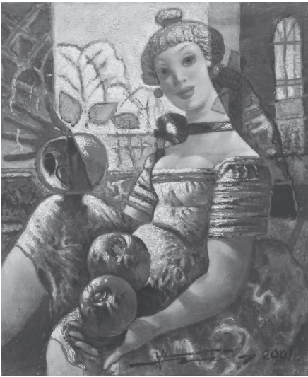
Микола Прокопенко. У білому саду. 2001. Полотно, олія. 100 × 85