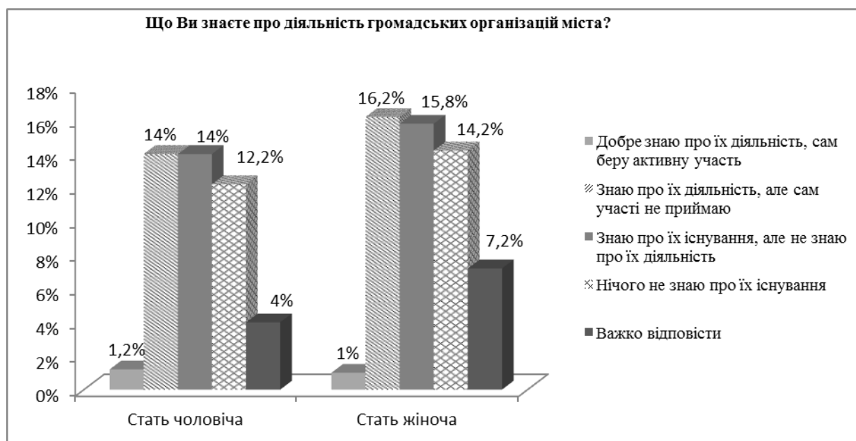
Рис. 1. Рівень інформованості про діяльність громадських організацій (статевий розподіл)

Таким чином, дослідження показало, що рівень інформованості жителів міста про діяльність громадських об'єднань знаходиться на низькому рівні.