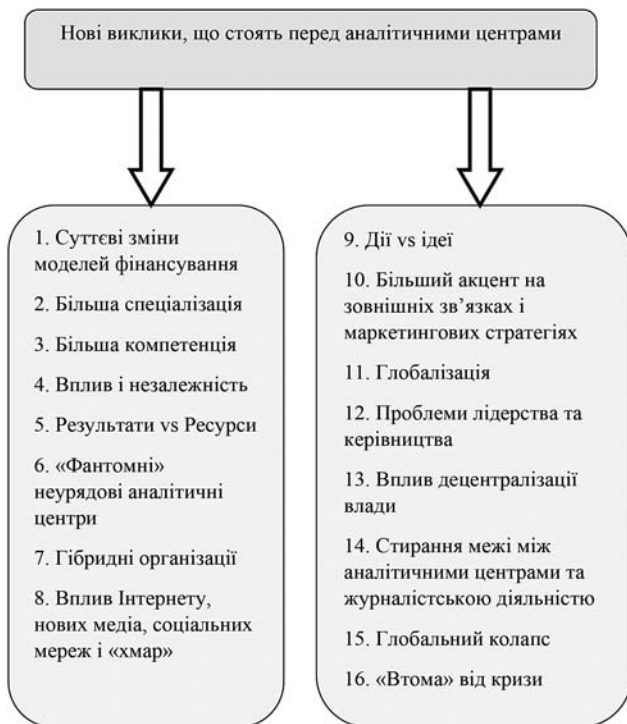
Рис 3. Нові виклики, що стоять перед аналітичними центрами

Головним завданням аналітичних центрів залишається підготовка вчасних і доступних політичних досліджень із критично важливих державних питань, до яких активно залучаються політичне керівництво, преса, суспільні діячі. Минули часи, коли аналітичні центри могли працювати під гаслом «досліджуй, записуй, а ті, кому потрібно, знайдуть».