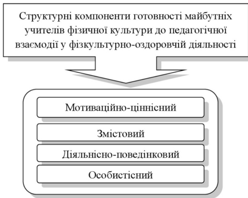
Рис. 2. Структурні компоненти готовності майбутніх учителів фізичної культури до педагогічної взаємодії у фізкультурно-оздоровчій діяльності

Отже, на основі теоретичного аналізу наукової літератури та власного досвіду викладацької діяльності було виділено такі структурні компоненти готовності майбутніх учителів фізичної культури до педагогічної взаємодії у фізкультурно-оздоровчій діяльності, як: мотиваційно-ціннісний, змістовий, діяльнісно-поведінковий та особистісний.