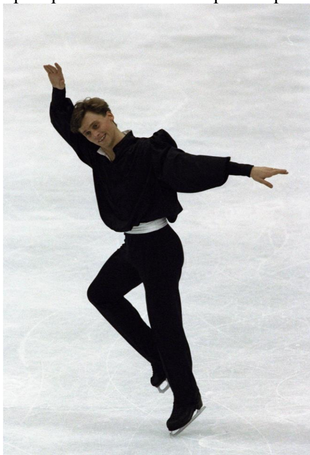
Віктор Петренко на Олімпіаді в Альбервіллі (1992 р.) завоював перше українське золото зимових Олімпійських ігор!