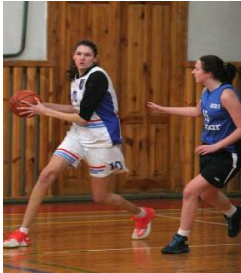
Команда ДЗ «ПНПУ імені К.Д. Ушинського» переможці першості області (2016 р.) серед ВНЗ (жінки) з баскетболу