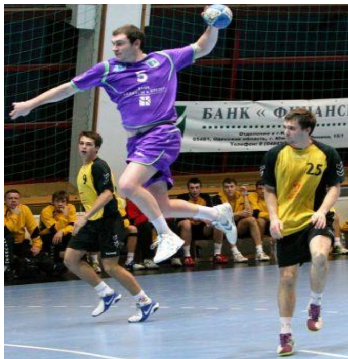
На змаганнях з гандболу

Основним напрямом науково-дослідної роботи кафедри є розробка нових методик, що сприяє підвищенню рівня підготовки учителів з фізичного виховання зі спортивних ігор. За час існування викладачі кафедри підготували понад 550 наукових і методичних робіт в галузі спортивних ігор. За дорученням МОН України кафедрою було розроблено навчальний план з розділу «Спортивні ігри» для всіх факультетів фізичного виховання. Кафедрі було визначено опорною серед аналогічних кафедр Південного регіону. Під час викладання спортивно-педагогічних дисциплін кафедра забезпечує підготовку майбутніх учителів фізичної культури з баскетболу, волейболу, гандболу, футболу, регбі, тенісу та бадмінтону. Протягом багатьох років на базі кафедри працювала наукова комплексна група при одеській жіночій волейбольній команді вищої ліги, очолювана Овчарком О. На кафедрі діють десять команд спортивно-педагогічного вдосконалення зі спортивних ігор, які неодноразово посідали призові місця в першості ВНЗ Одеси та України.