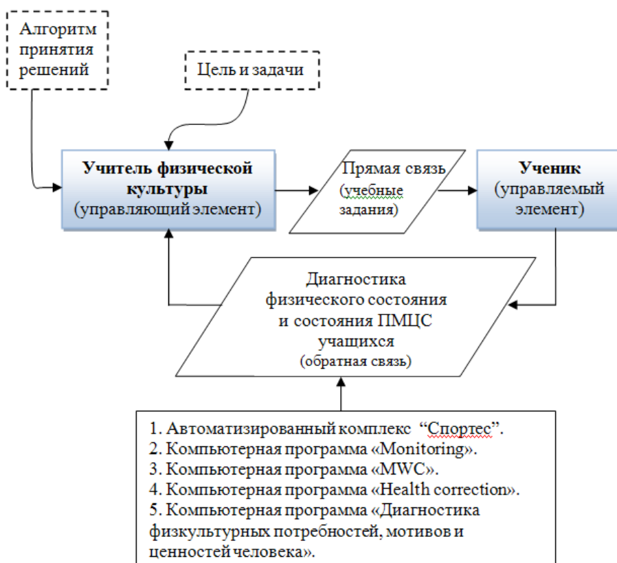
Рисунок 2 – Модель автоматизированного педагогического контроля физического состояния и состояния ПМЦ физической культуры школьников

В нашей работе мы попытались разработать модель автоматизированного педагогического контроля физического состояния и состояния потребностно-мотивационно-ценностной сферы физической культуры школьников (рисунок 2).