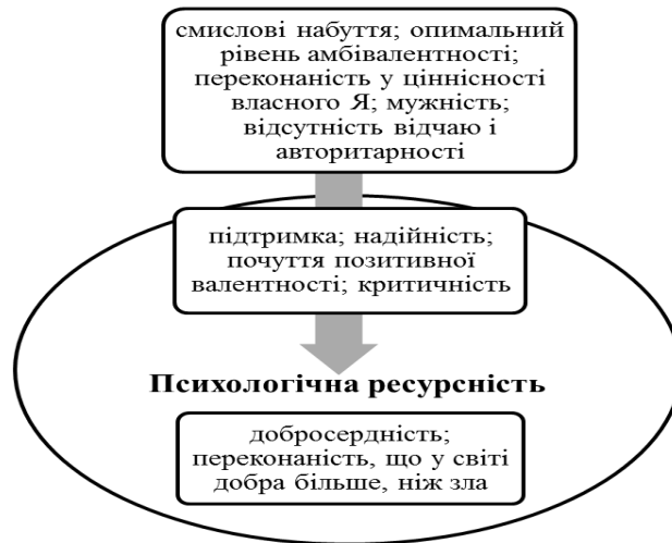
Рис. 2. Чинники та структурні компоненти психологічної ресурсності (на основі даних багатofакторного ієрархічного та регресійного аналізу)

Висновки та перспективи дослідження. Проаналізовано проблему чинників ставлення ресурсної особистості до інших. На теоретичному рівні проблему локалізовано як додання індивідуалізму. Емпірично встановлено, що ресурсні ставлення будуються за типом міжособистісних взаємин "добросердність" на основі досвіду підтримки інших.