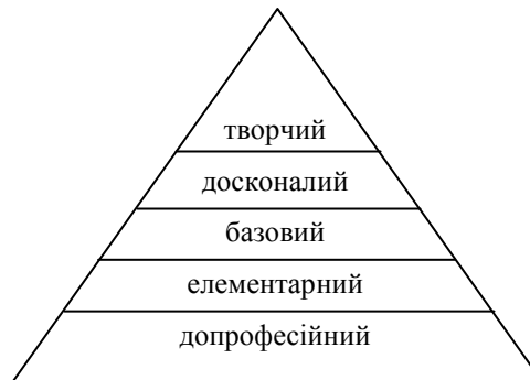
Рис. 2. Рівні оволодіння педагогічної майстерності.

Висновки. Таким чином, підсумовуючи наш огляд, можна сказати, що сутність ПМ полягає у набуті під час професіоналізації якостей особистості самого педагога, які, власне, забезпечують його успішність. ПМ – це високий рівень педагогічної діяльності.