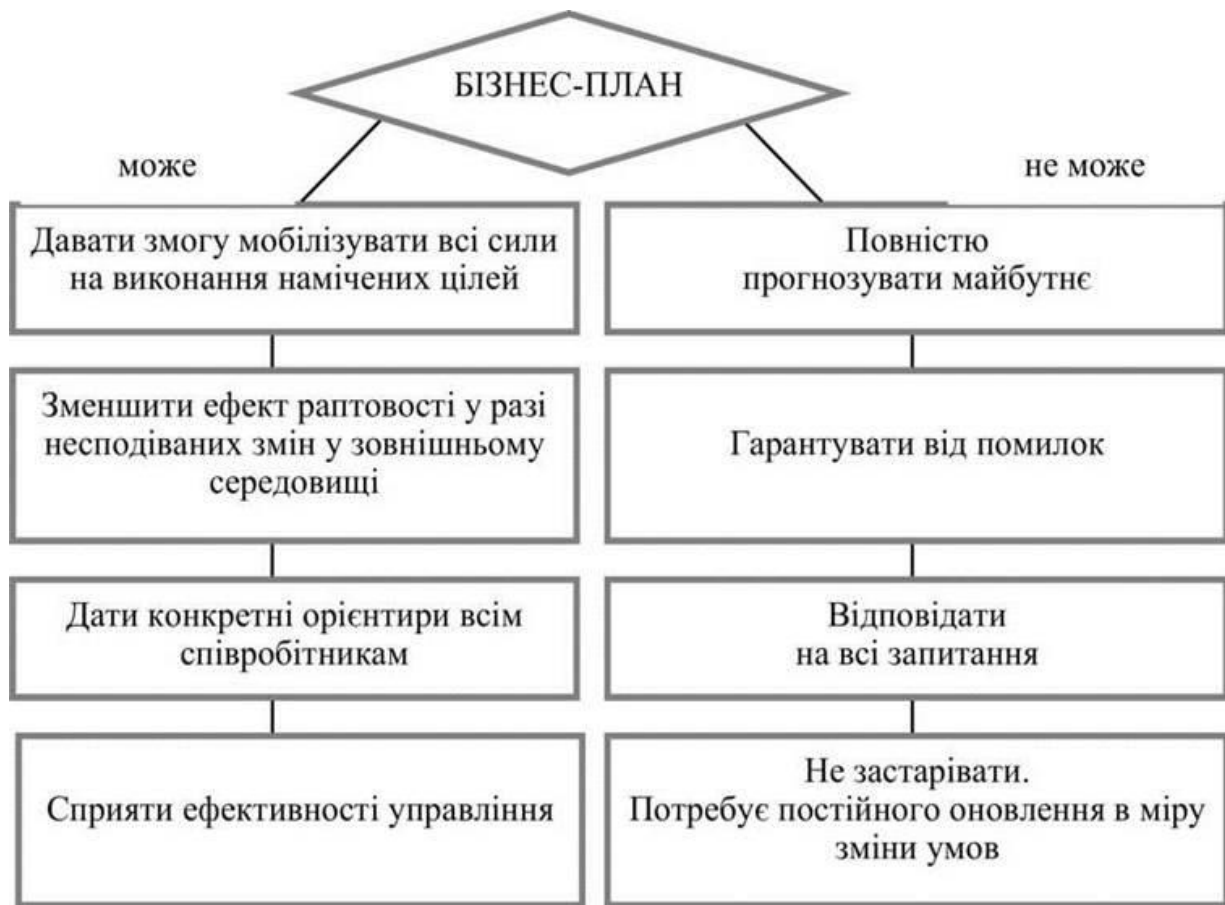
Рис. 1. Можливості бізнес-плану

Складання бізнес-плану — нагальна потреба, продиктована виробничою діяльністю. Скласти його повинні фахівці, професіонали при безпосередній участі бізнесмена. Робота над планом — це робота над організацією виробничої діяльності. Вона допомагає керівникові краще все обмірковувати, зважити. При розробці бізнес-плану можна дійти висновку про те, що перешкоди на шляху до успіху надто серйозні. Зрозуміло, цей висновок краще зробити раніше, ніж тоді, коли будуть втрачені гроші і час.