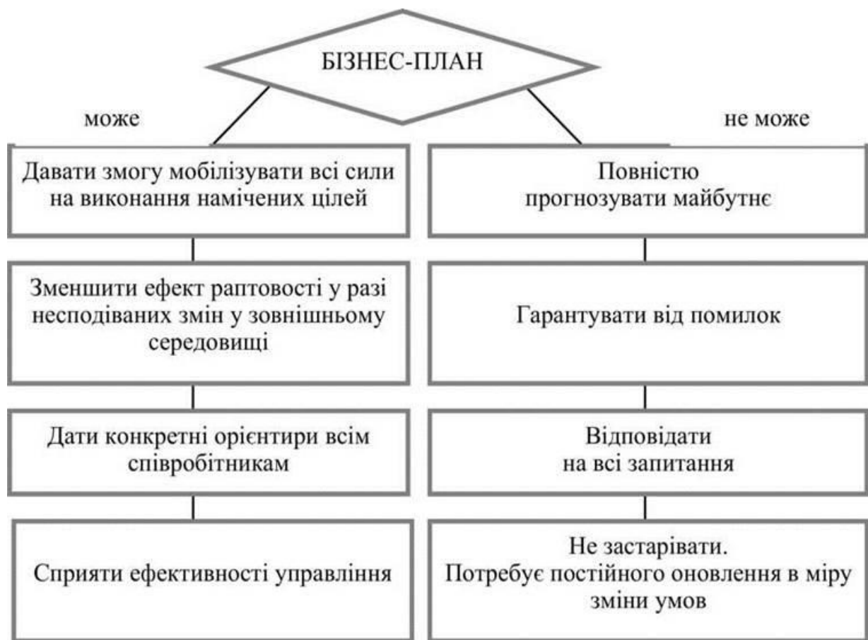
Рис. 1. Можливості бізнес-плану

Складання бізнес-плану — нагальна потреба, продиктована виробничою діяльністю. Складати його повинні фахівці, професіонали при безпосередній участі бізнесмена. Робота над планом — це робота над організацією виробничої діяльності. Вона допомагає керівникові краще все обміркувати, зважити. При розробці бізнес-плану можна дійти висновку про те, що перешкоди на шляху до успіху надто серйозні. Зрозуміло, цей висновок краще зробити раніше, ніж тоді, коли будуть втрачені гроші і час.