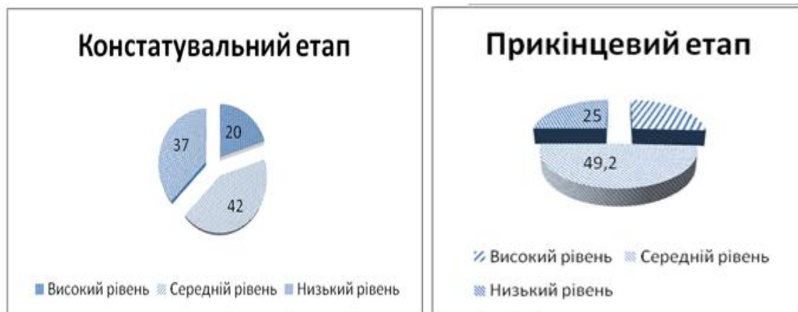
Рис. 2. Динаміка змін рівнів розвитку естетичних оцінних суджень майбутніх учителів початкової школи в контрольній групі на констатувальному та прикінцевому етапах експерименту (у %)

оцінних суджень майбутніх учителів початкової школи в процесі здійснення експериментальної роботи.