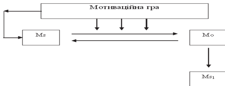
Схема II сценарію.