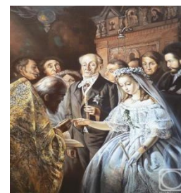
В. Пукирев. «Нервний шлюб»

- Особисто мені на пари, де чоловік старший за дружину років десь на 15 і більше, дивитися огидно. На мою думку, все це – виключно задля зиску. Як може молода вродлива дівчина кохати чоловіка, який її у батьки годиться?! Річ у тім, що не любить вона його зовсім. Їй подобаються його гроші. І чим багатше буде рибка, тим більше молодих красунь захочуть її зловити. Сучасним дівчатам не соромно продавати своє тіло та свою молодість. Адже замість того вони отримують забезпечене існування: брендові ганчірки, коштовні цяцьки, великі будинки та машини. Я не суддя та звинувачувати нікого не хочу. Мабуть, їх можна зрозуміти. Життя сьогодні дуже дороге, тяжке, хочеться забезпечити не лише власне майбутнє, а й майбутнє своїх дітей. Заради цього можна й потерпіти