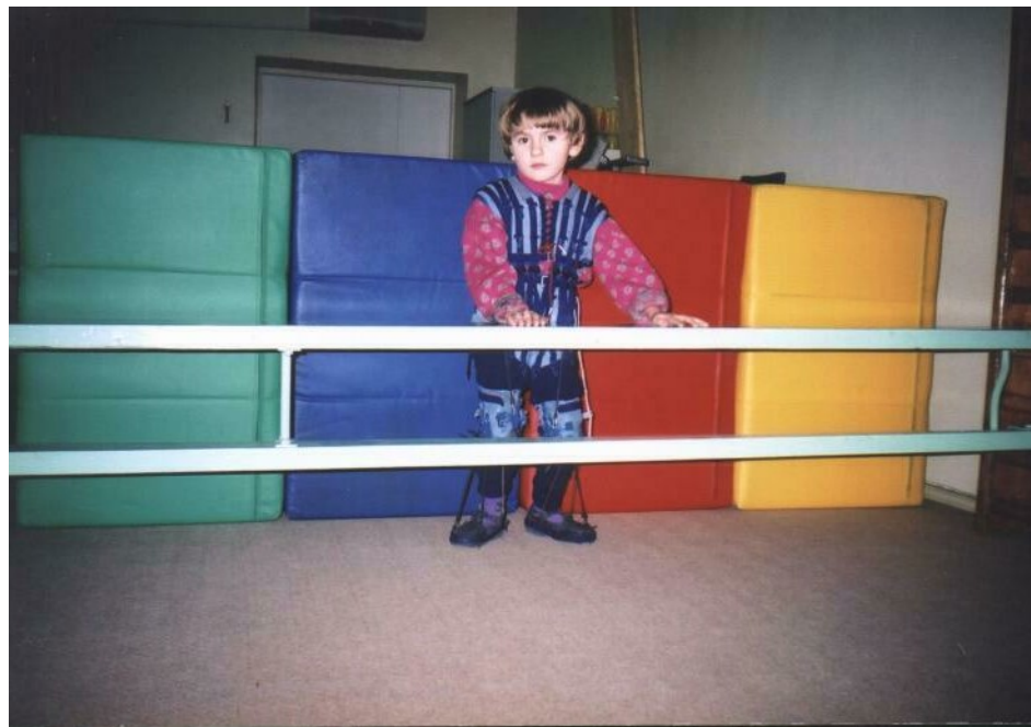
Рис А.1.1.3. Неподвижная горизонтальная передняя опора