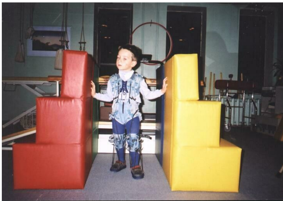
Рис. А.1.2.1. Неподвижная вертикальная двусторонняя опора