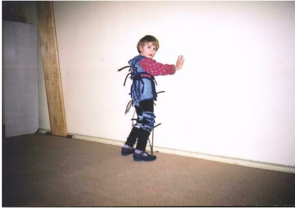
Рис. А.1.2.3. Неподвижная вертикальная передняя опора