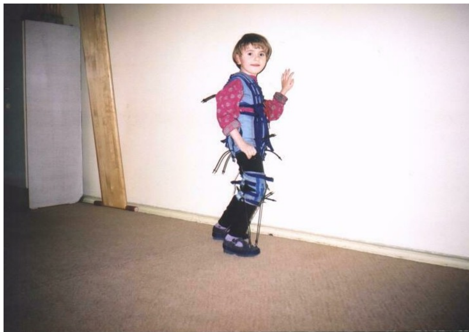
Рис. А.1.2.2. Неподвижная вертикальная односторонняя опора