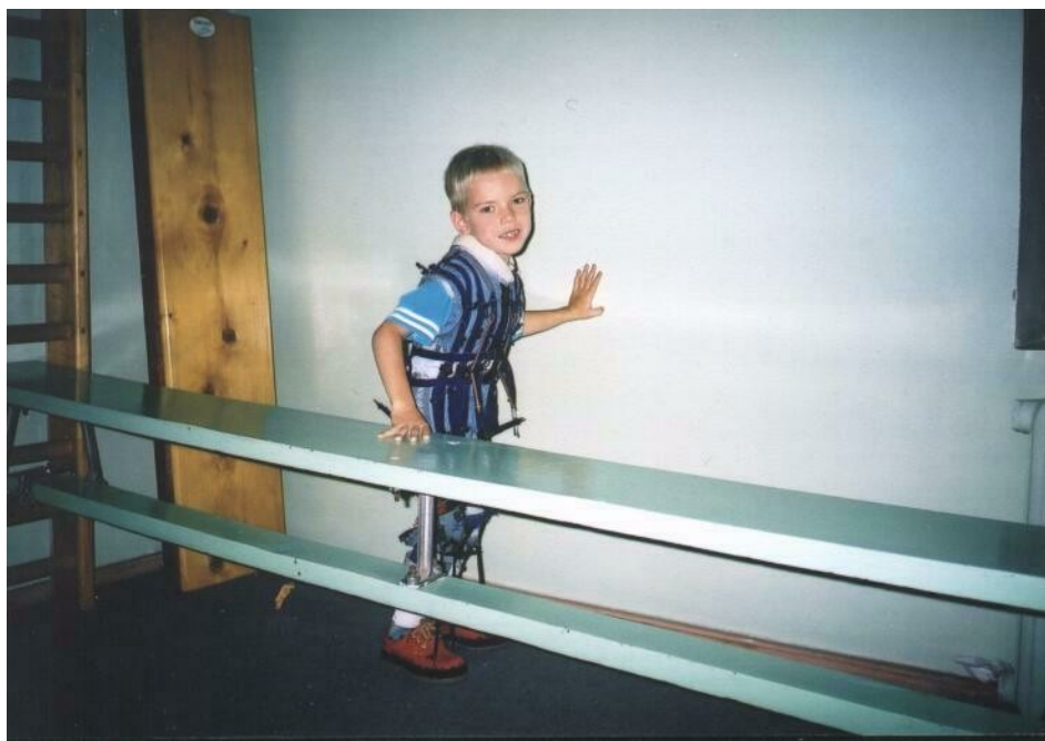
Рис. А.1.3.1. Неподвижная вертикально-горизонтальная комбинированная опора