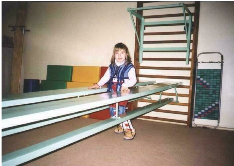
Рис. А.1.1.1. Неподвижная горизонтальная боковая двусторонняя опора