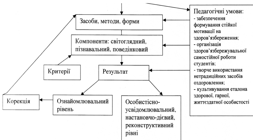
Мал. 1 Модель формування культури здоров'язбереження як світоглядної орієнтації студентів-економістів

Студенти експериментальних груп заповнювали щоденник самоконтролю, паспорт здоров'я, розробляли програму самооздоровлення, залучалися до заняття у спортивних секціях та участі у спортивних і фізкультурно-оздоровчих заходах для збільшення годин їхньої рухової тяжкої активності, складала комплекси вправ для профілактики найбільш поширених професійних захворювань, притаманних фахівцям економічного профілю, здобували необхідні знання, вміння та навички на заняттях з педагогіки, психології та культурології через застосування активних форм навчання, розбір творчих завдань, підготовку рефератів, написання есе, аналіз педагогічних плакатів, вирішення ситуаційних завдань, що сприяло формуванню їхньої світоглядної орієнтованості на здоров'язбереження та відповідального ставлення до власного здоров'я та здоров'я оточуючих.