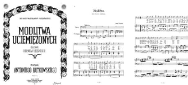
Pieśń Modlitwa uciemżonych do słów Kornela Ujejskiego