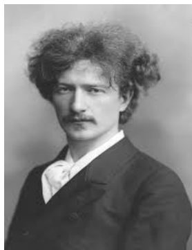
Fot. Ignacy Jan Paderewski