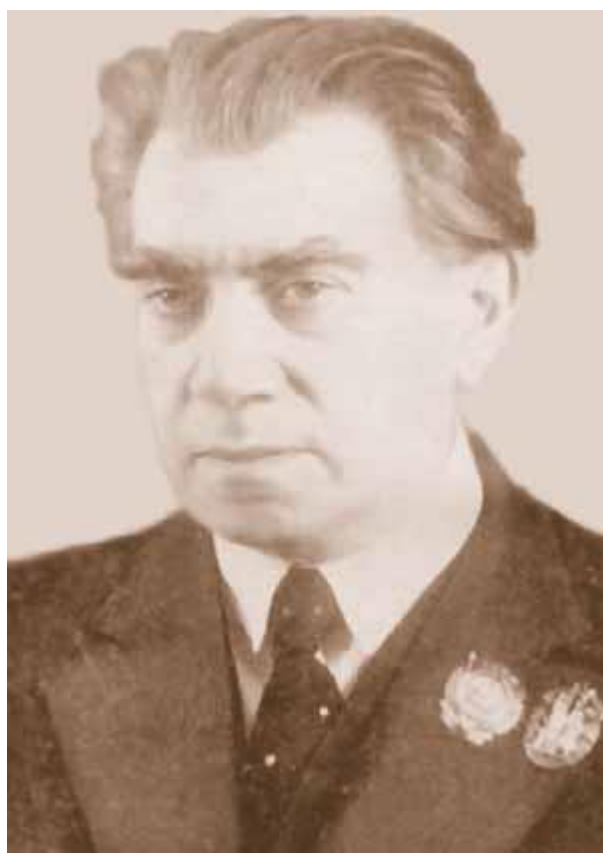
Рейнгольд Морицевич Глиэр