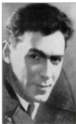
Л. О. Утёсов