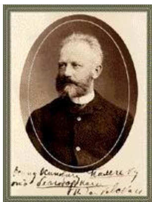
П. И. Чайковский