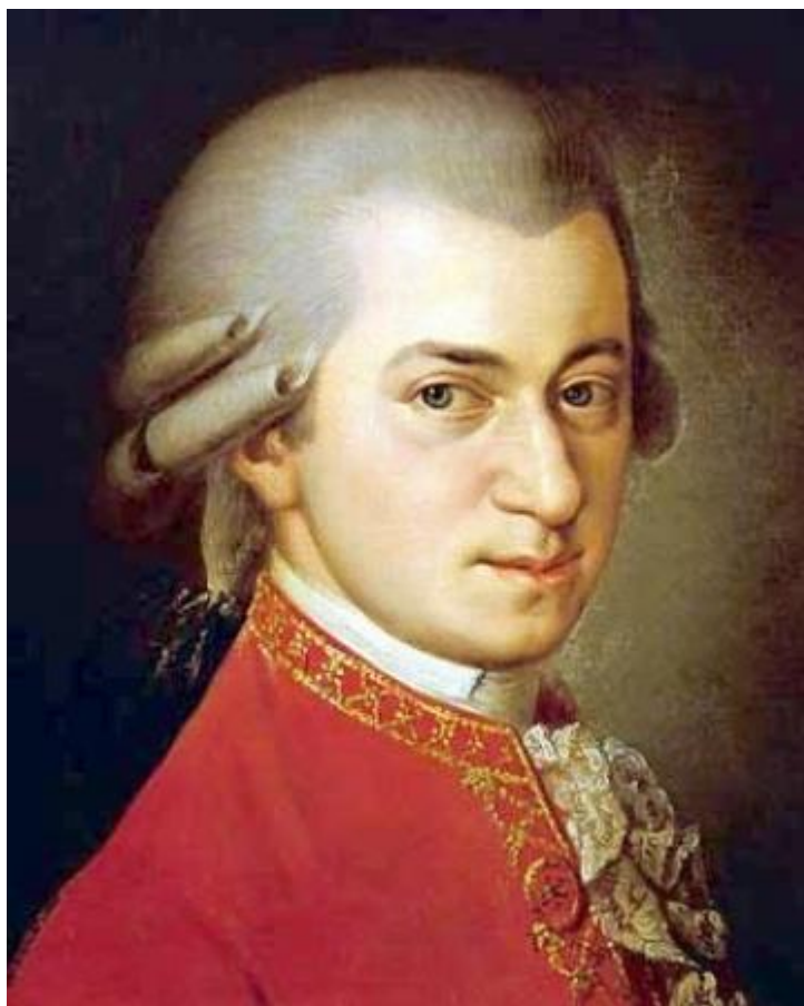
Вольфганг Амадей Моцарт