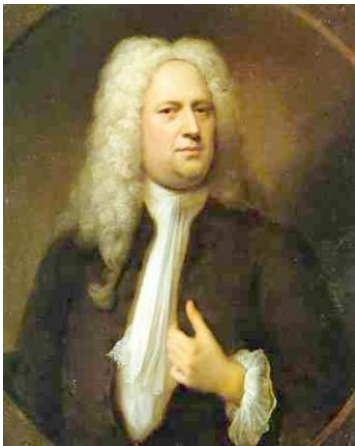
Георг Фридрих Гендель