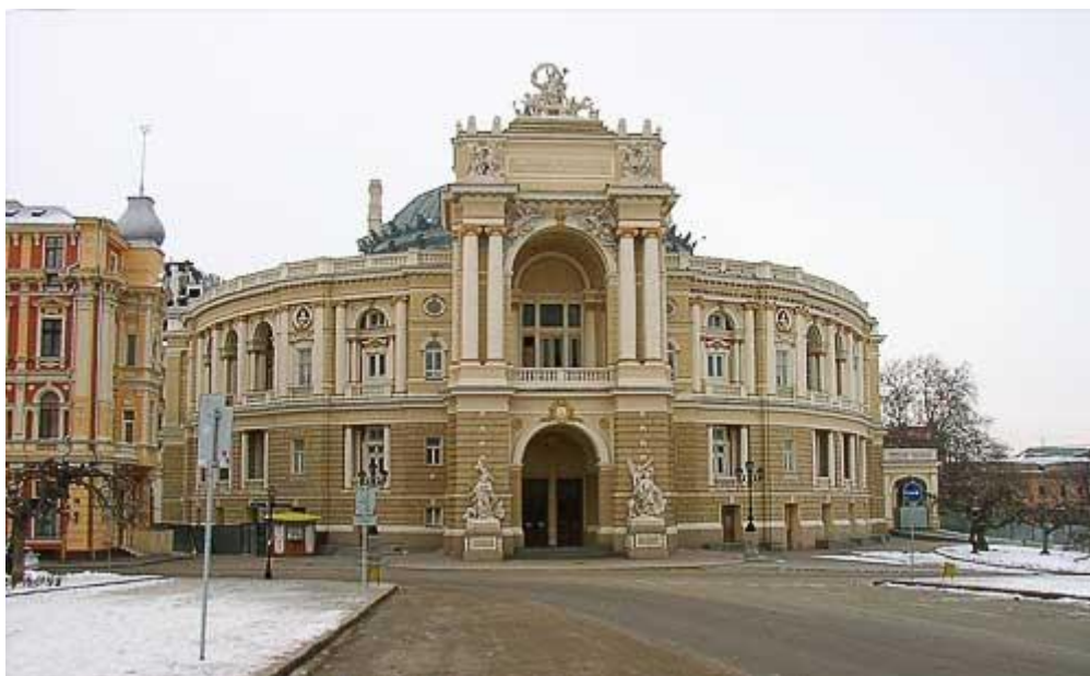
Одесский театр Оперы и Балета