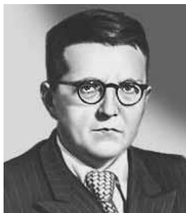
Д. Д. Шостакович