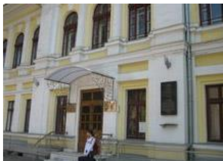
Одесская государственная музыкальная академия им. А. В Неждановой