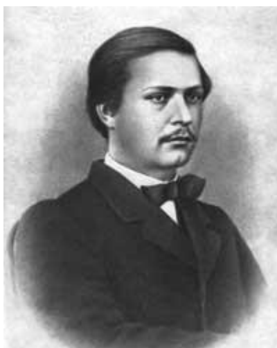
Николай Витальевич Лысенко