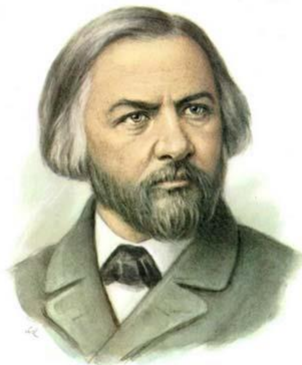
Михаил Иванович Глинка