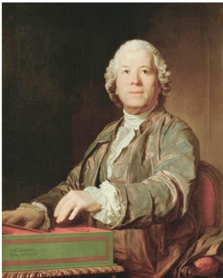
Кристоф Виллибальд Глюк